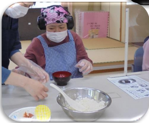
熱々のご飯をよそって～