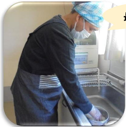
最初にお米をとぎます